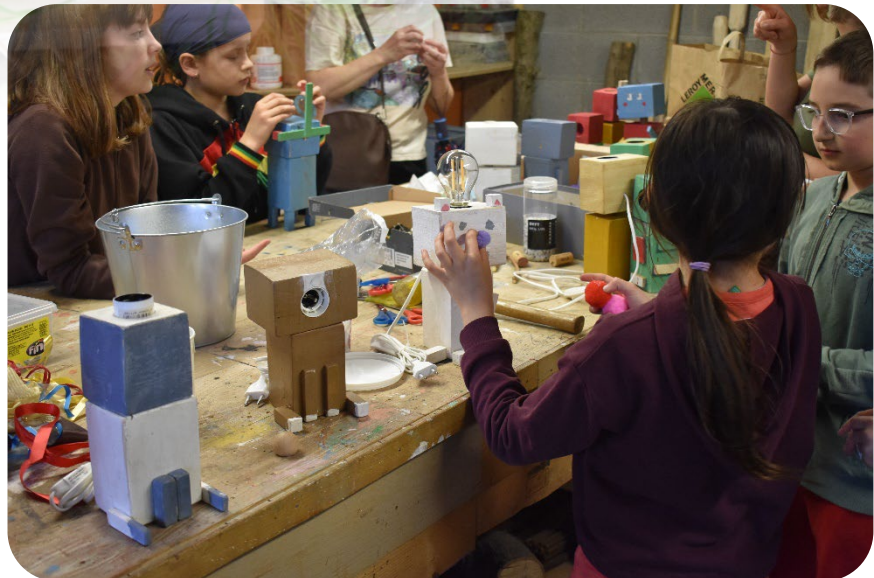
Al lavoro ...