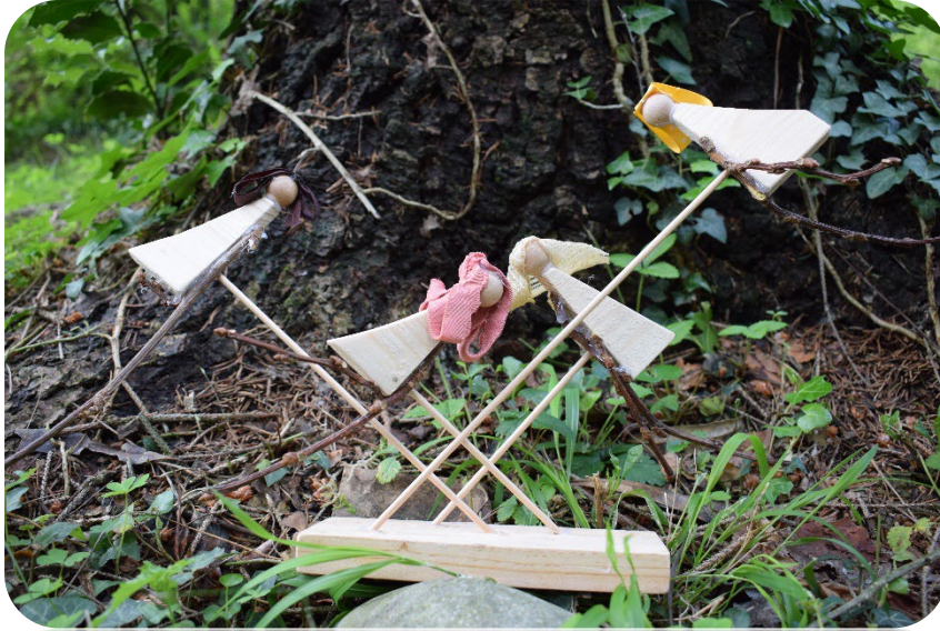
La danza delle streghe